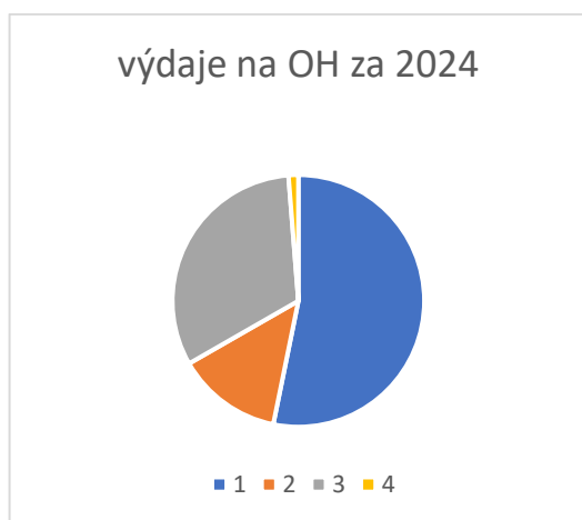
Graf č. 2: Výdaje na OH v roce 2024

Oproti roku 2023 se finanční náklady zvýšily zejména z důvodu dražších služeb svozových firem (pohonné hmoty navýšení) a současně probíhajícího systému svozu ze společných stanovišť a systému DOOR TO DOOR.